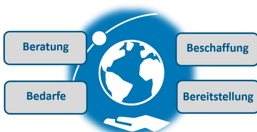
Abbildung 1: "4xB" - die Services der Servicestelle Fernerkundung.

Das BKG setzt mit der Servicestelle Fernerkundung einen Beschluss des Interministeriellen Ausschusses für Geoinformationswesen (IMAGI) um und schafft für die Einrichtungen des Bundes per Abruf kurzfristig verfügbare und kostenfreie Zugänge zu kommerziellen Satellitenbilddaten in sehr hoher Auflösung.