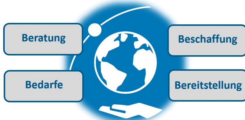
Abbildung 1: "4xB" - die Services der Servicestelle Fernerkundung.

Das BKG setzt mit der Servicestelle Fernerkundung einen Beschluss des Interministeriellen Ausschusses für Geoinformationswesen (IMAGI) um und schafft für die Einrichtungen des Bundes per Abruf kurzfristig verfügbare und kostenfreie Zugänge zu kommerziellen Satellitenbilddaten in sehr hoher Auflösung.